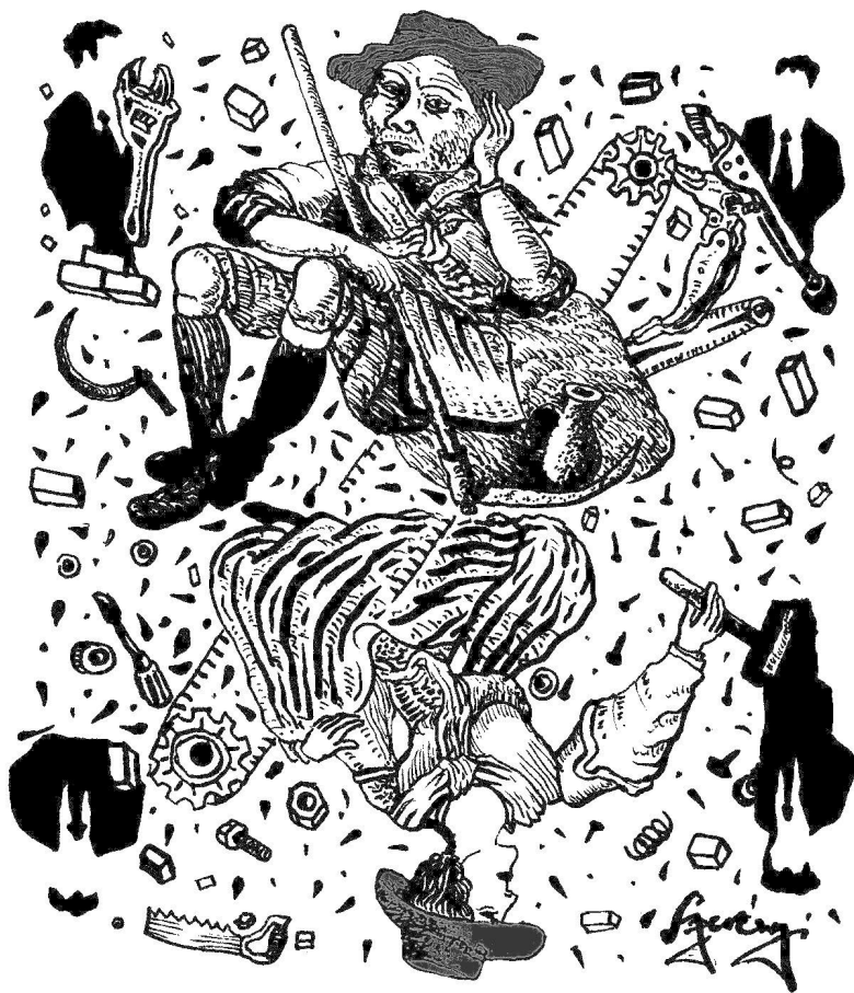
Szerényi Gábor, Tagállam kontra tagállam