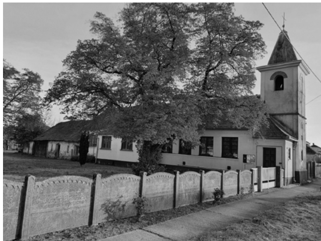
1. ábra: Evangélikus templom és az egykori iskola, Vasegerszeg