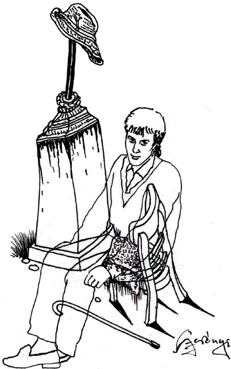
Szerényi Gábor grafikája