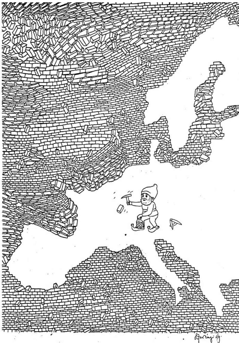
Szerényi Gábor grafikája