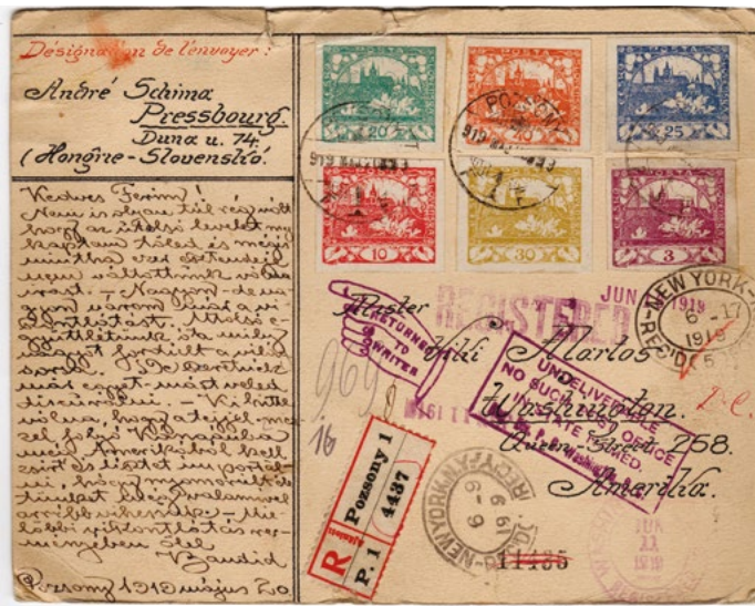
Amerikai zsír és liszt Pozsonynak, 1919. (magántulajdon)