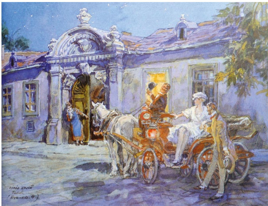
Tabán, Árok köz 4.