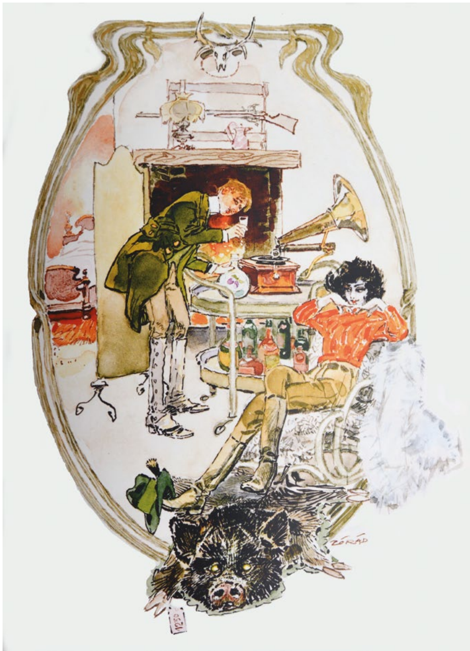
Krúdy Gyula. Az emlékek szakácskönyve című könyvének egy illusztrációja.