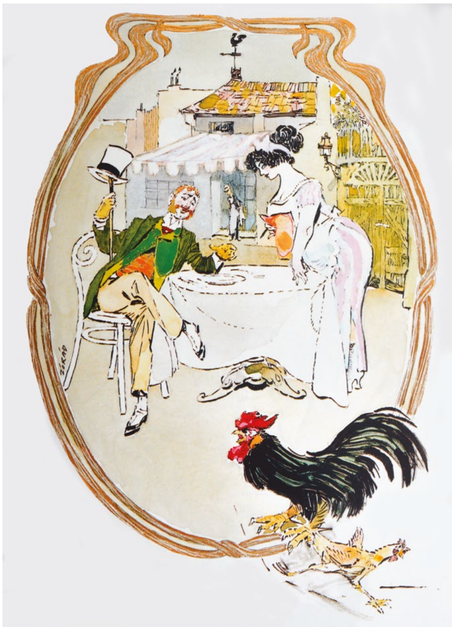
Krúdy Gyula Az emlékek szakácskönyve című könyvének egy illusztrációja