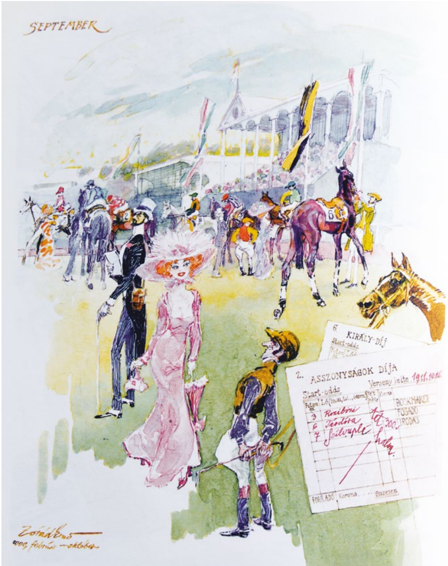
Kalandozások egy régi fiákeren (írta és szerk.: Verő László, Fekete Sas kiadó) Utazások Rezeda Kázmérral című fejezetének illusztrációja