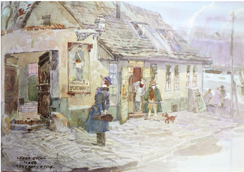
Tabán, Kereszt utca