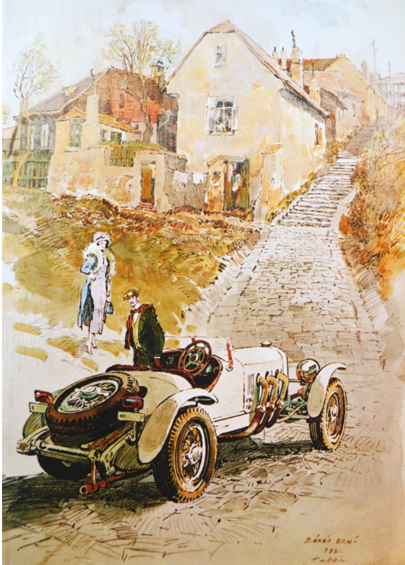
Tabán, Kőműves lépcső