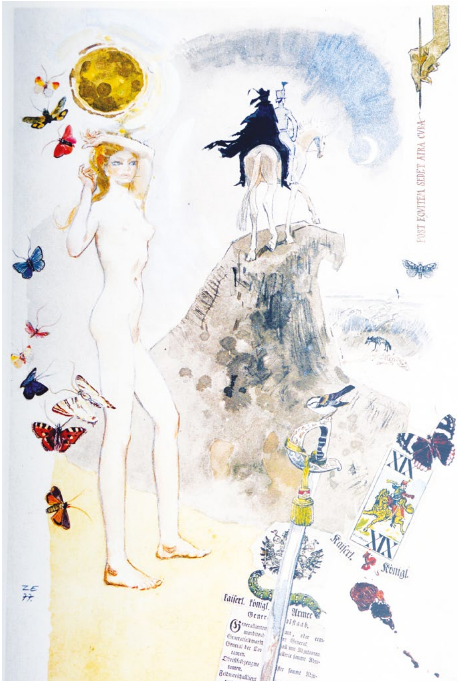
Az utolsó huszár