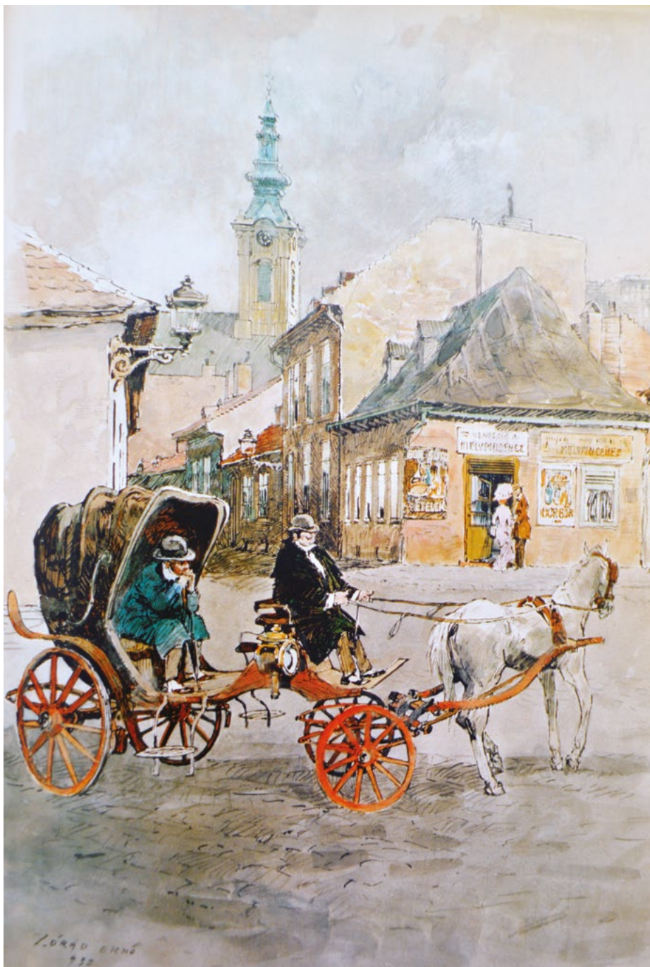
Tabán, Fehér sas utca és a Mélypince