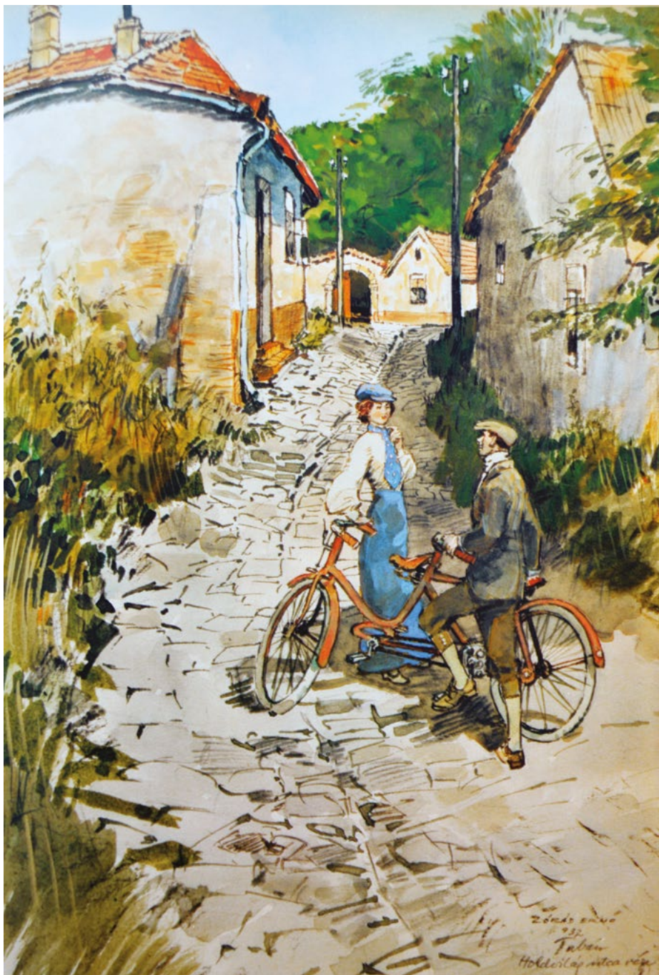
Tabán, Holdvilág utca vége