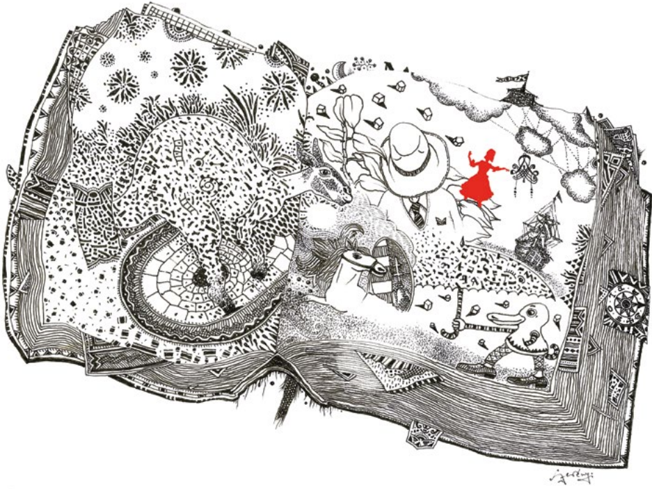
Szerényi Gábor, Most