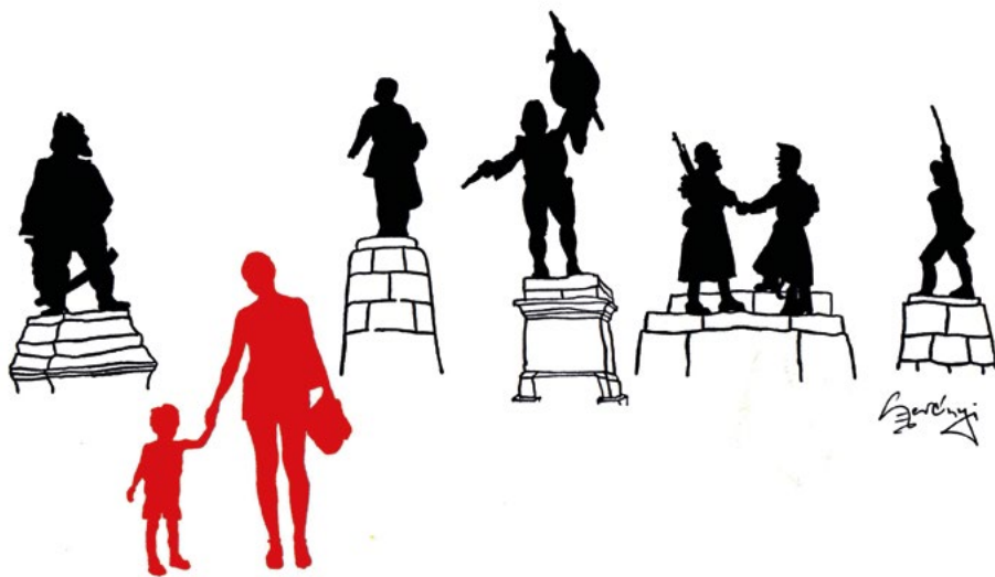
• Szerényi Gábor, Család