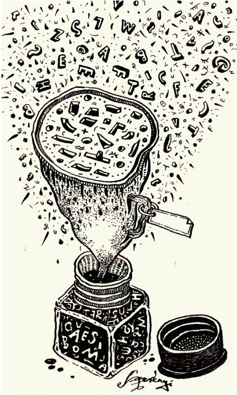
Szerényi Gábor, Dimenziók 3.