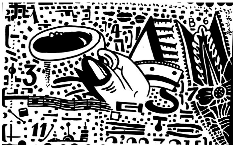
Szerényi Gábor, A Cup of Tea