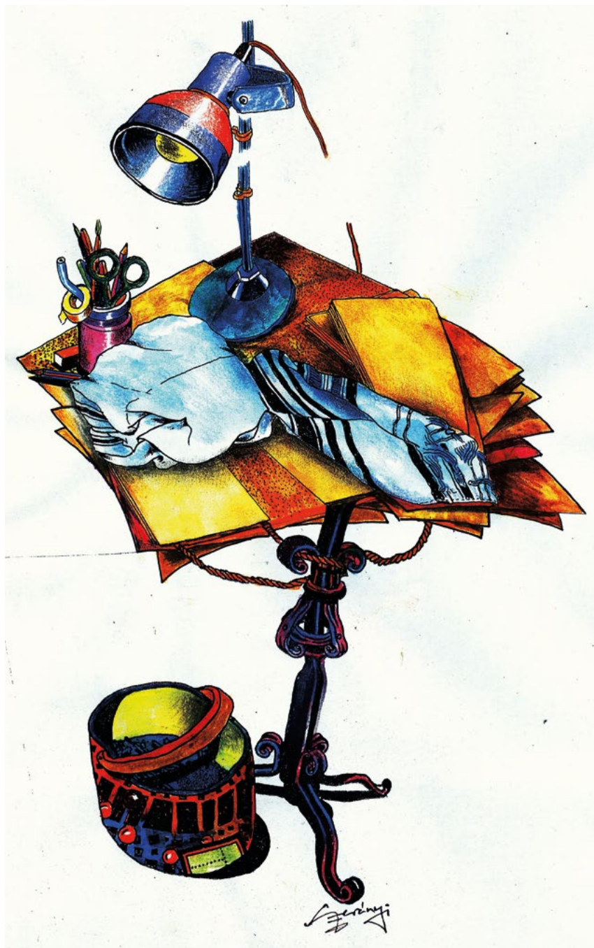
Szerényi Gábor, Atelier