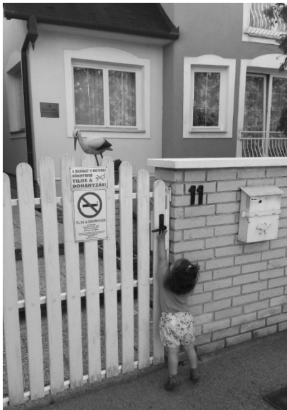
Köszönet a gólyának az utazásért 2016, győri Kaáli Intézet