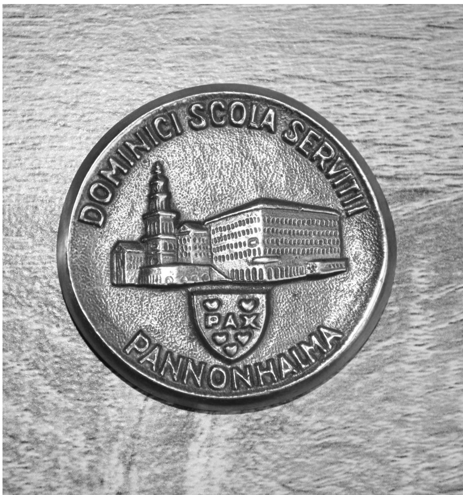
Pannonhalmi Apátság bronz emlékérmé, 1980