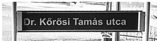
Dr. Kőrösi Tamásról elnevezett utca névtáblája Győrben, 2022-ben