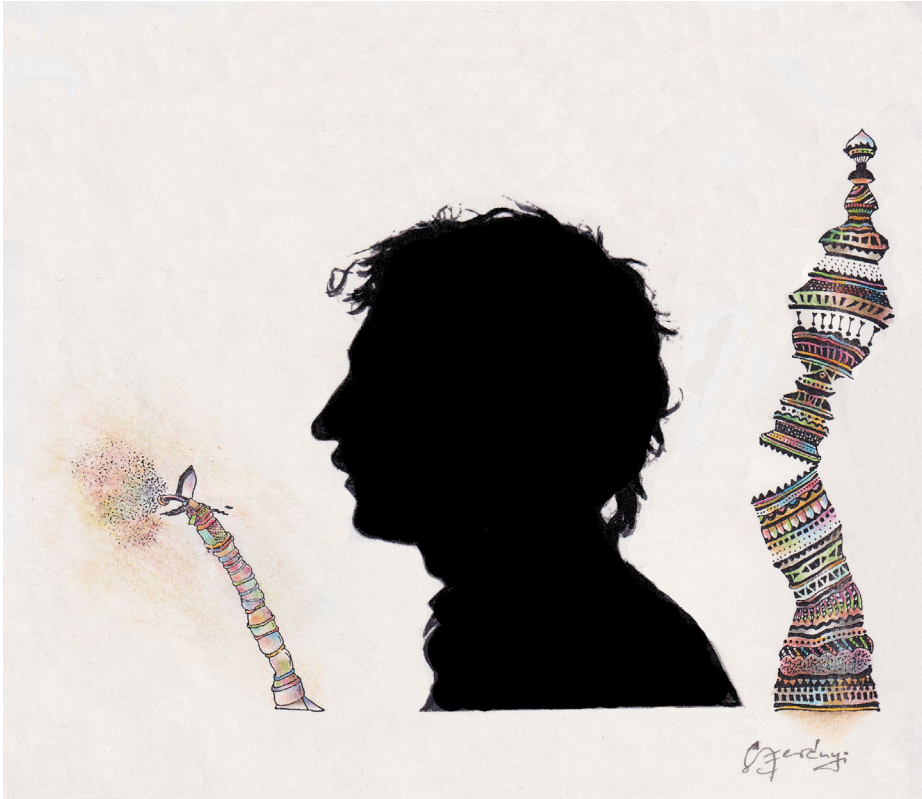
Szerényi Gábor grafikája